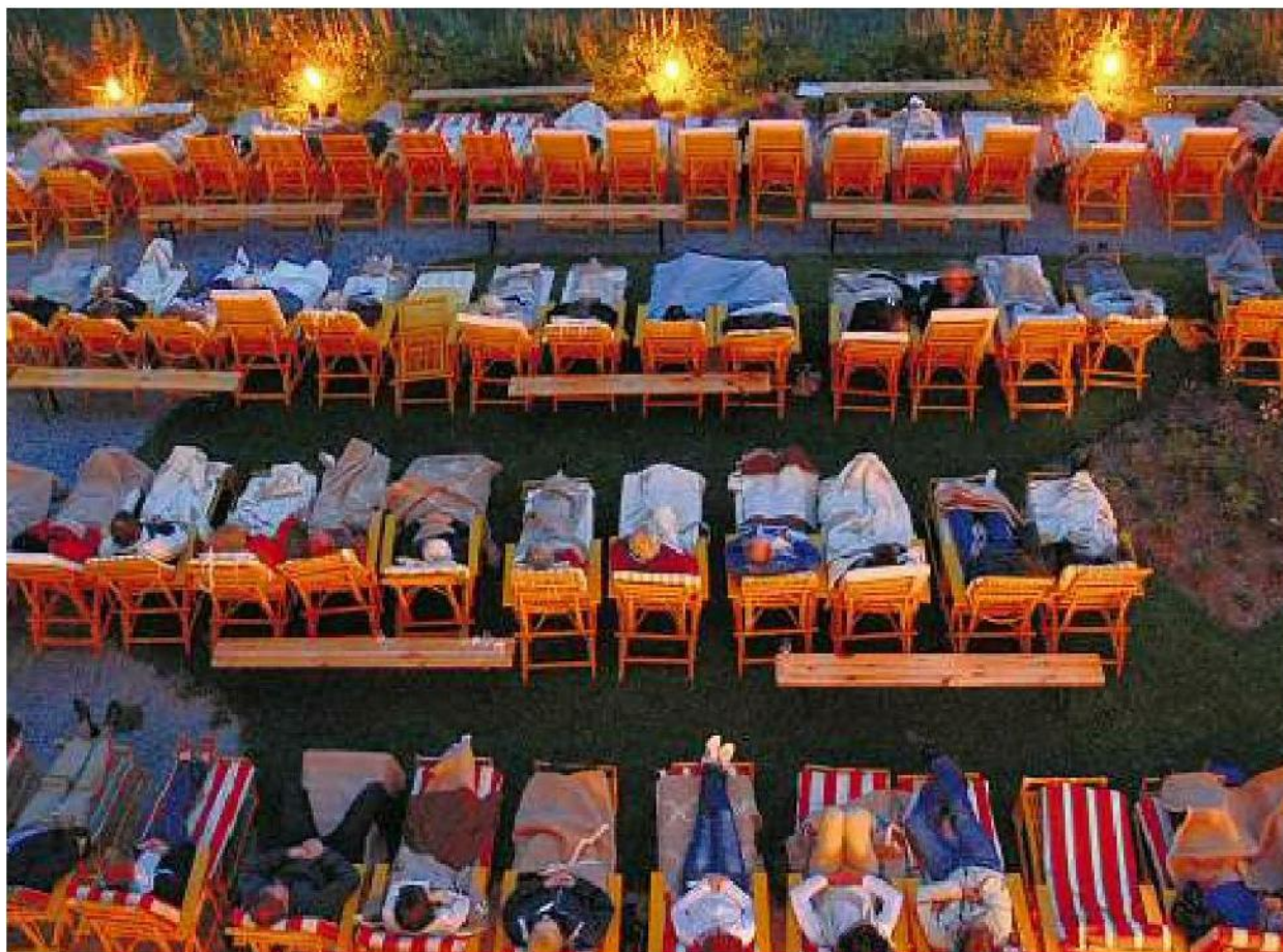
In der Horizontalen: Das Davoser Publikum war beim Liegekonzert zwar nicht auf Rosen, aber bequem gebettet.